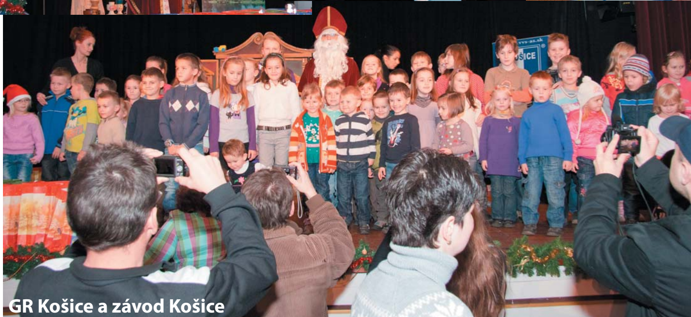
GR Košice a závod Košice