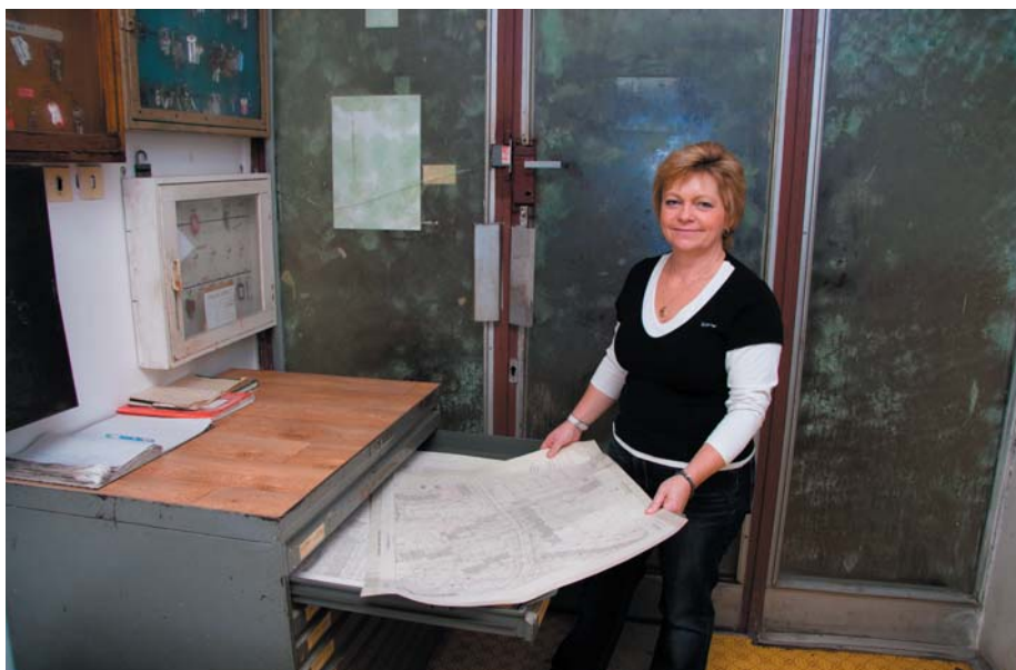
Mapy a podklady sú starostlivo uschované.