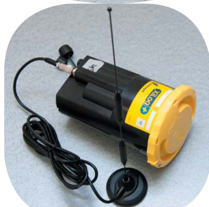
Dispečingu pomáhajú rôzne prístroje a zariadenia.