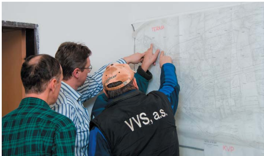
Bez podrobnýchb máp a nákresov sa nedá ani pohnúť.