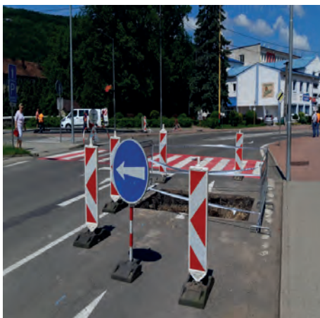
Obmedzenia dopravnej situácie v centre mesta.

Závod Humenné, stredisko Medzilaborce v júni odštartovalo práce na investičnom projekte „Medzilaborce, ul. Mierová, Duchnovičova – stavebné úpravy vodovodu“ s celkovým objemom finančných prostriedkov vo výške cca 40 000 EUR.