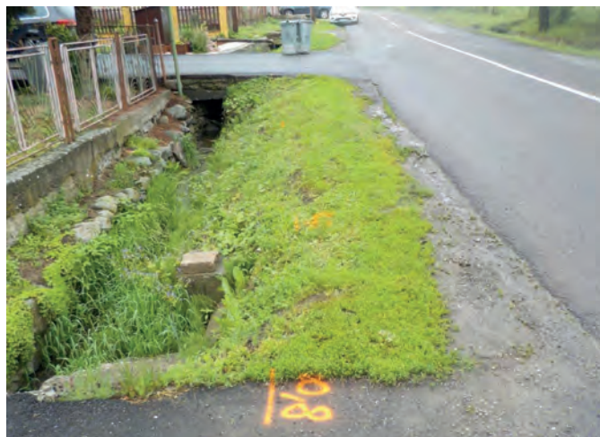
Choňkovce – rozšírenie vodovodu