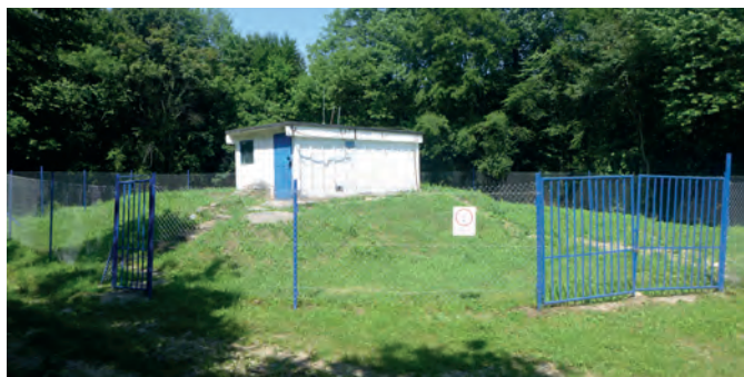
VDJ Kaluža - rekonštrukcia oplatenia