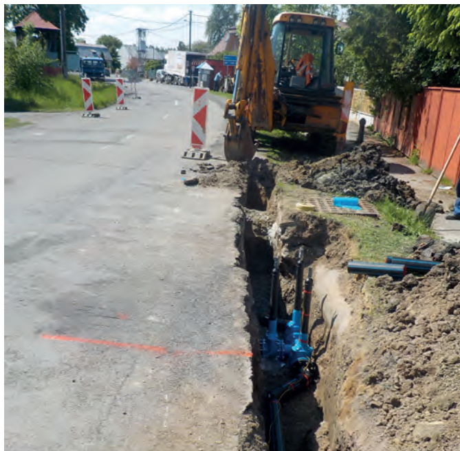
Michalovce, Vrbovecká ul., rekonštrukcia vodovodu

• Na základe Plánu malých investícií na rok 2019 začína závod Michalovce s rozšírením vodovodu v obci Choňkovce v rámci stavby „Choňkovce – rozšírenie vodovodu“. V súčasnosti sa vykonávajú terénne úpravy a vytyčovanie podzemných vedení.