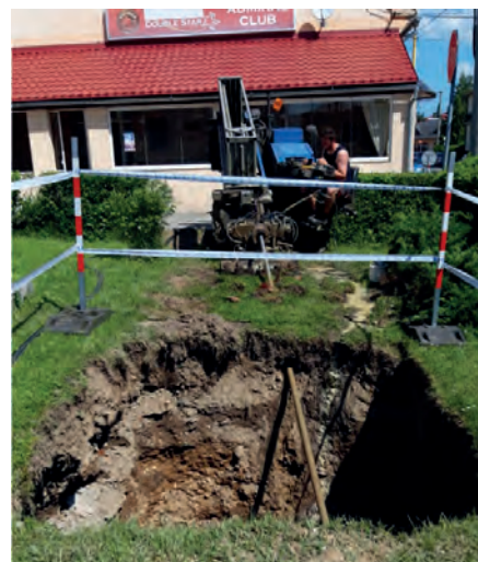
Realizácia bezvýkopovou technológiou, takzvaným horizontálnym riadeným vŕtaním.

Uloženie potrubia sa realizuje bezvýkopovou technológiou, tzv. horizontálnym riadeným vŕtaním. Celej tejto akcii podliehala dôkladná príprava - materiálové zabezpečenie a spraco-