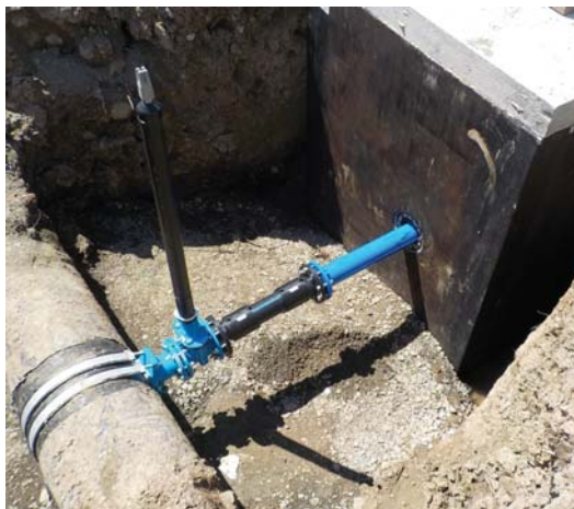
Obec Jovsa - výstavba vodovodu

ČOV Lastomír, ktorú závod prevádzkuje, z dôvodu jej opotrebovania. Tak tiež aj výmenu kanalizačných šacht v Michalovciach na kanalizačnej vetve od ulice Nad Laborcom smerom na KPS Suvorovova, ktoré boli poškodené.