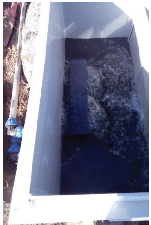
ČOV Lastomír - výmena rozdeľovacej nádrže

• VVS, a.s., závod Michalovce v rámci plánu malých investícií na rok 2018 v tomto období finišuje s výstavbou časti vodovodu v obci Jovsa. Stavbu realizujú pracovníci strediska pomocných činností, ukončenie je naplánované na 30. 11. 2018.