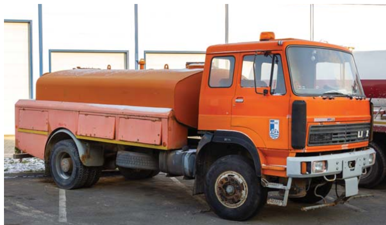
Liaz CAK 8, rok výroby: 1991, závod Košice

Celkovo VVS, a.s. prevádzkuje 10 kusov špeciálnych sacco-kanalizačných vozidiel rôznych továrenských značiek na podvozkoch, napríklad Iveco, Mercedes a Tatra. Obmena vozového parku a náhrada starších modelov tak prispieva k ďalšiemu skvalitňovaniu služieb poskytovaných pre zákazníkov VVS, a.s..