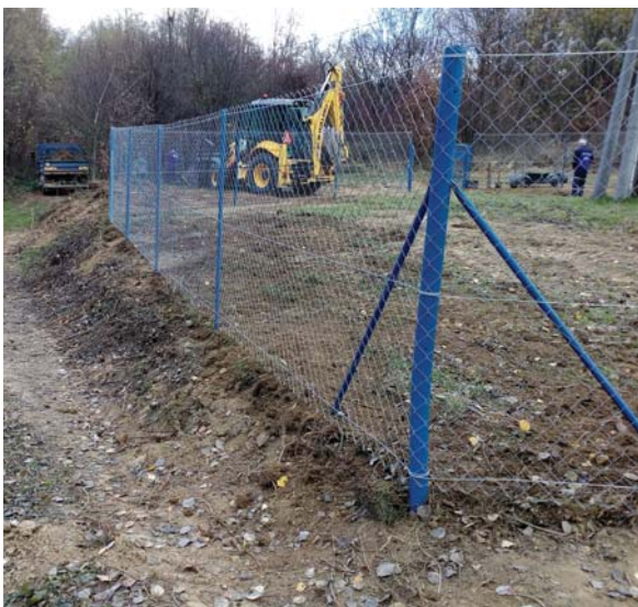
Vodný zdroj Kolibabovce - oplotenie