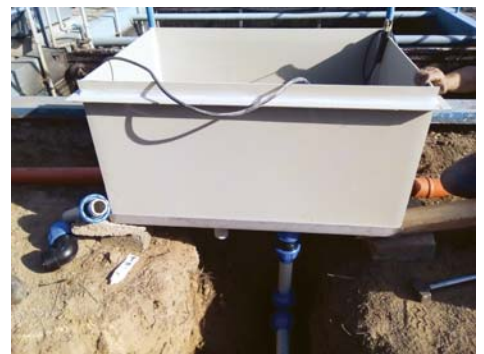
ČOV Lastomír - výmena rozdeľovacej nádrže