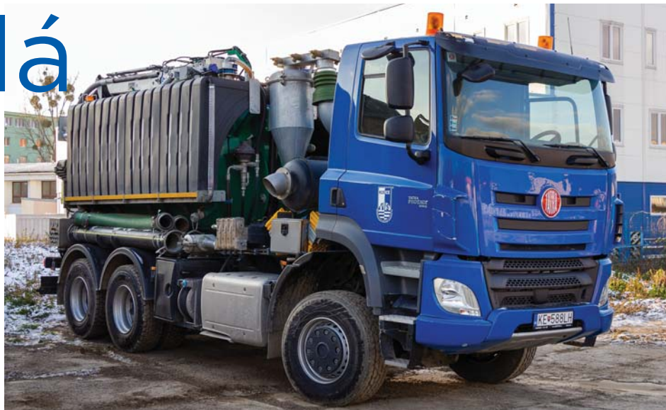
Tatra Phoenix KOMBO 12, rok výroby: 2017, závod Košice