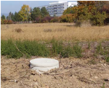
Výmena kanalizačných šacht, Michalovce