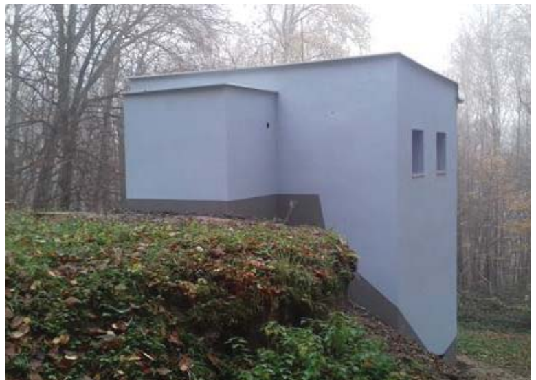
Vodojem Pusté Čemerné - oprava