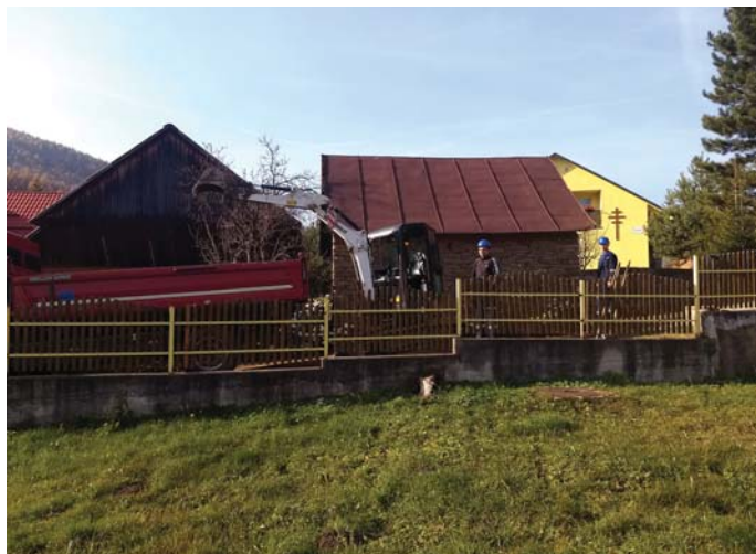
Osem prípojk na ulici Jarková, Orkucany