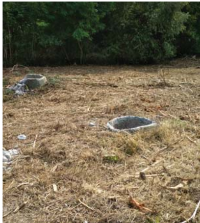
Poškodené kanalizačné šachty, Michalovce