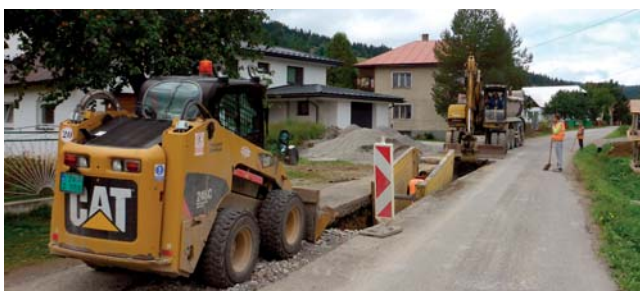
Budovanie gravitačnej kanalizácie v štátnej ceste III. tr. v obci Zákamenné.