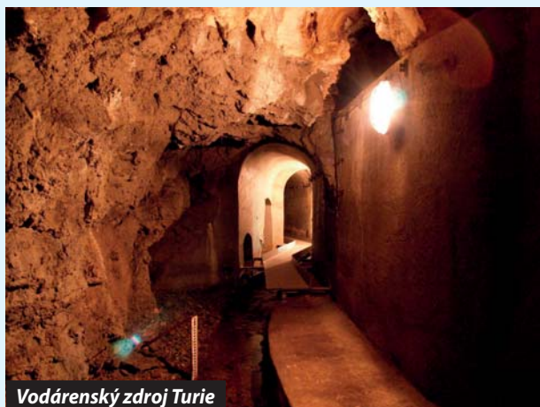
Vodárenský zdroj Turie