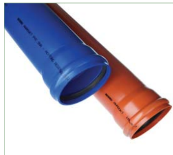
AWADUKT PVC SN8, SN12 DN/OD110-500