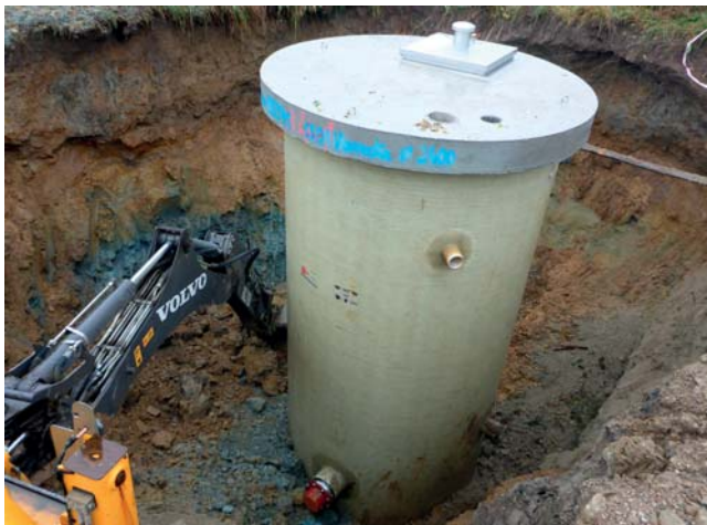
Osadenie čerpacej stanice odpadových vôd v obci Vavrečka. Uzatvorený čerpací systém STRATE v podzemnej sklolaminátovej prefabrikovanej nádrži.