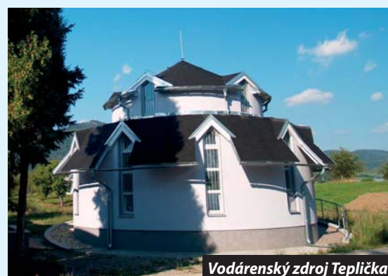
Vodárenský zdroj Teplička

Pozitívnym zistením bolo, že na otázku, koľkí študenti pijú vodu z vodovodu, zdvihlo ruky viac ako 80 % prítomných.