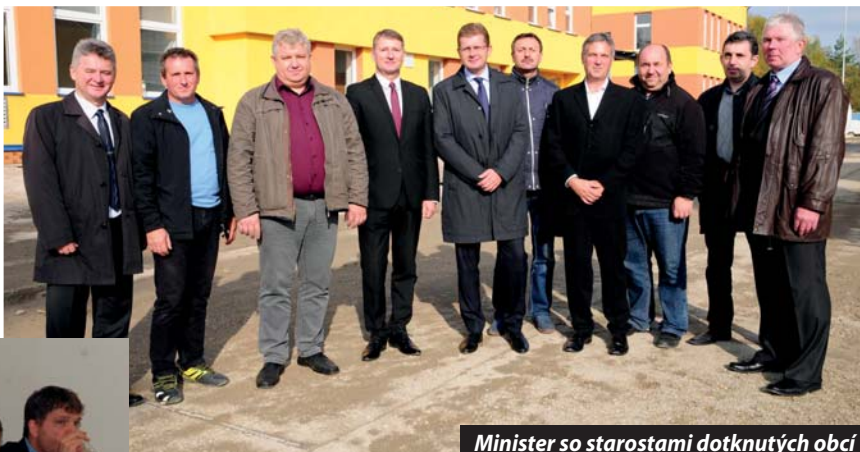
Minister so starostami dotknutých obcí