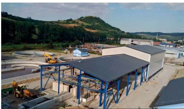
ČOV Nižná nad Oravou. Novovybudovaný objekt monobloku č. 2 a dvoch dosadzovacích nádrží. Rekonštrukcia vstupnej čerpacej stanice, haly hrubého predčistenia a budovy odvodnenia kalu.