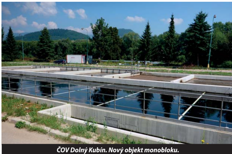
ČOV Dolný Kubín. Nový objekt monobloku.