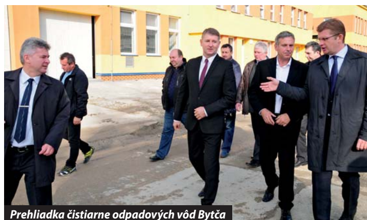
Prehliadka čistiarny odpadových vôd Bytča

Na kontrolnom dni sa zúčastnili zástupcovia MŽP SR, Asociácie vodárenských