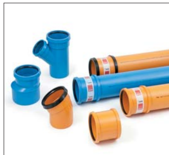
AWADUKT PP SN10, SN16 DN/OD110-630